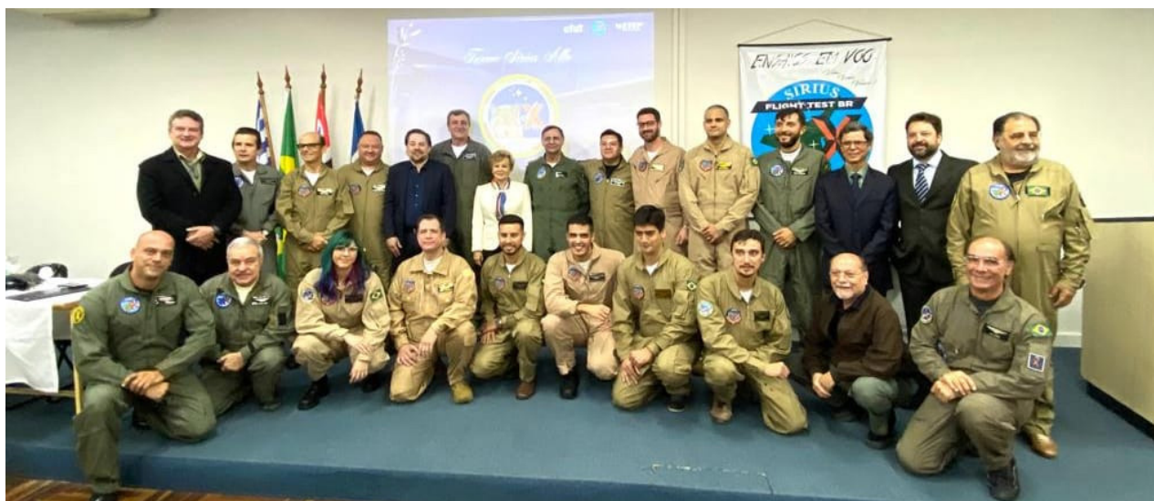
Formandos da Primeira Turma de Pós Graduação em Ensaio de Voo da América Latina