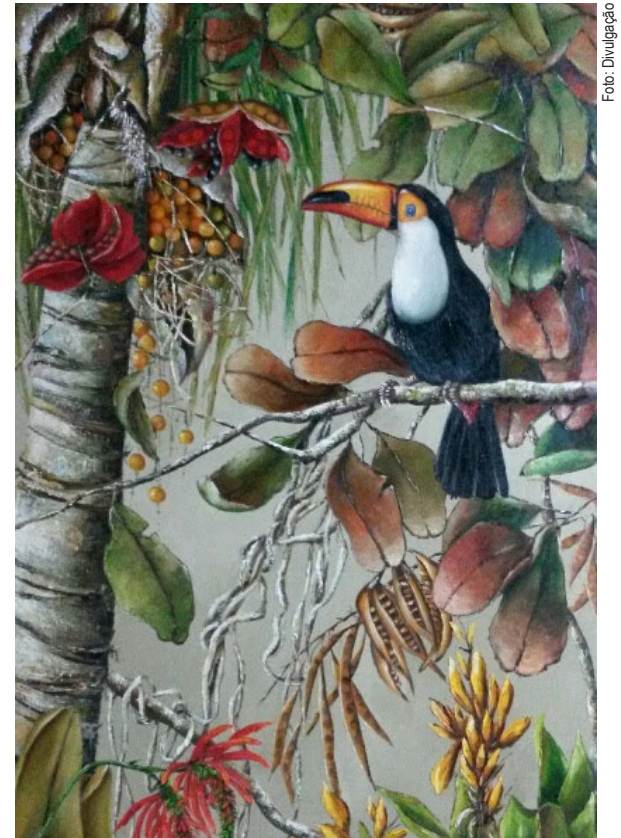
Título - Tucano - Óleo/tela 1.00 m X 1.80 m