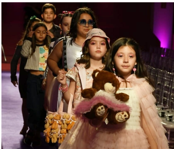
Crianças Brilhando na Passarela