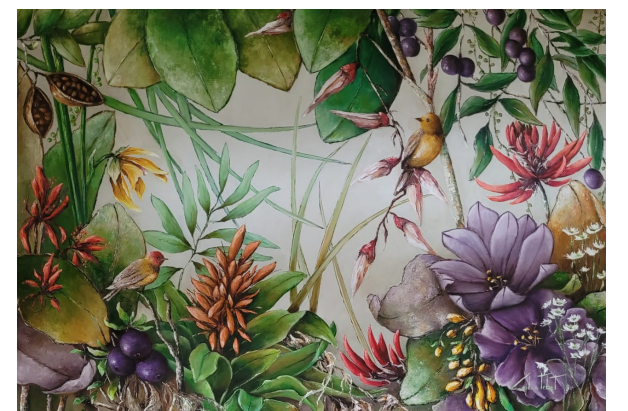
Título - Ora-pró-nobis - Óleo/tela 0.90 m X 1.30 m