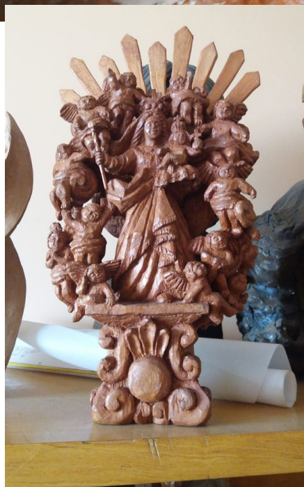
N.S. da Vitória